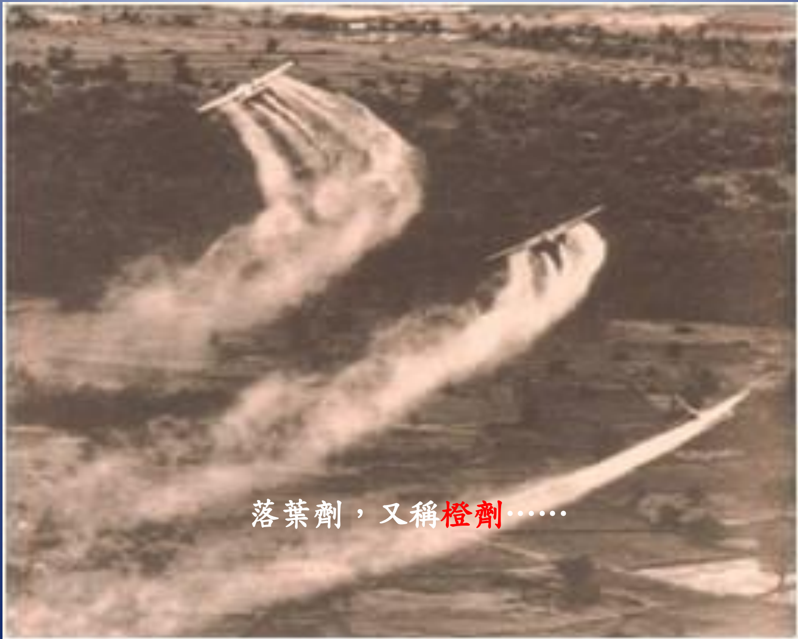
落葉劑，又稱 橙劑 ……